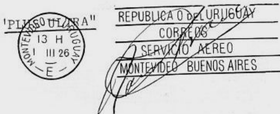
Matasellos del vuelo de Franco con la firma del piloto

Otro matasello que se encuentra sobre esta emisión es el que fué usado el 20 de