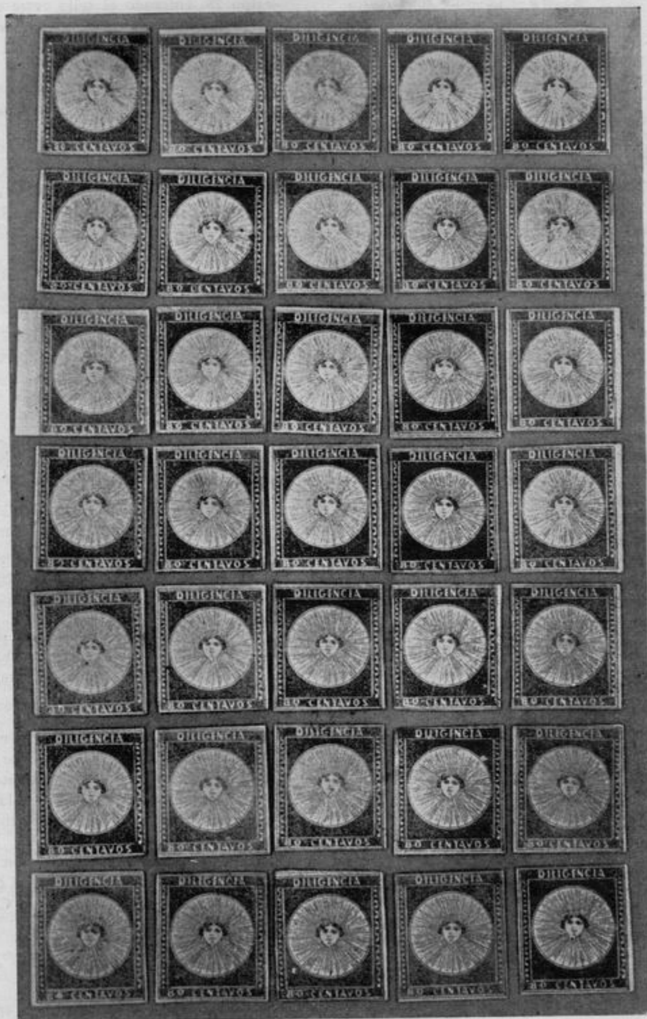
Los 35 tipos del sello de 10 cts. "Diligencia". Colección ROBERTO HOFFMANN